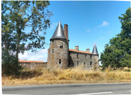
Propriété privée, aucune visite possible

Le château actuel date du XV ème siècle. Il a été édifié au centre d'un triangle où siégeaient de puissantes forteresses (Les Essarts, la Chaize le Vicomte et Bournezeau). Le château