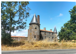
Propriété privée, aucune visite possible

Le château actuel date du XV ème siècle. Il a été édifié au centre d'un triangle où siégeaient de puissantes forteresses (Les Essarts, la Chaize le Vicomte et Bournezeau). Le château servait alors de relais entre ces points forts. De nombreux vestiges témoignent encore aujourd'hui de cette position : des tours de défense avec bretèches et archères canonnières.